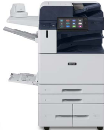
Xerox® AltaLink® C8130/C8135/ C8145/C8155/ C8170 Multifunktions- Farbdrucker