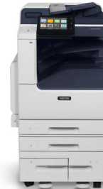
Xerox® VersaLink® B7125/B7130/ B7135 Multifunktions- Drucker