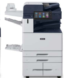
Xerox® AltaLink® B8145/B8155/ B8170 Multifunktions- Drucker

*Produkt nicht in allen Regionen verfügbar, bitte wenden Sie sich an Ihren Verkaufsrepräsentanten.